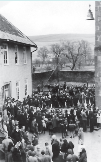
1950: Eine der beiden neuen Glocken wird unter den gespannten Blicken vieler Beobachter zum Kirchturm hinaufgezogen.

Am Samstagnachmittag um 14 Uhr läuten alle Glocken und erinnern die Menschen, sich auf den kommenden Sonntag vorzubereiten. Sonntagmorgens um 8 Uhr wird der „Tag des Herrn“ festlich eingeläutet und wir wissen, dass heute die Arbeit ruhen darf und wir Gott im sonntäglichen Gottesdienst danken und loben sollen, aber auch unsere Sorgen und Nöte vor ihn bringen dürfen.