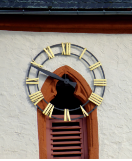
Nordseite der Uhr von außen.