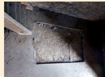
Platz, wo das alte Uhrwerk stand.