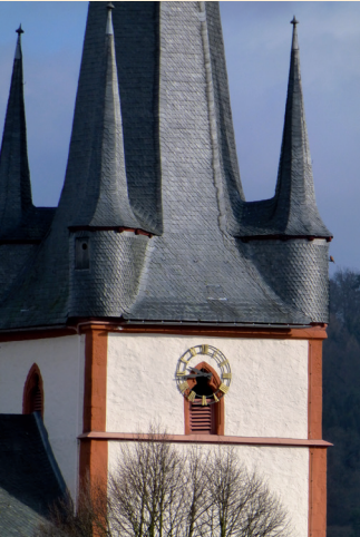
Uhr nach Süden.