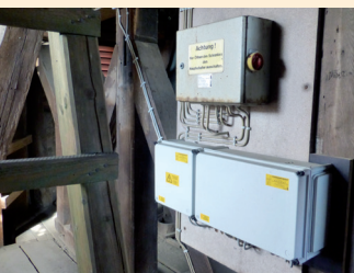
Neues Uhrwerk aus den 60-ern.

Text: Gisela Hilbrig, Bilder: Gisela und Christoph Hilbrig)