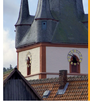
Kirchturmuhre nach Ost und Nord.