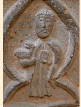
Johannes mit dem „Lamm Gottes“.

Dass der Stein einmal zerbrochen war und wieder zusammengefügt wurde, sehen wir am Schaft. Ähnliche Taufsteinen in Pokalform, sie werden auch Bonifatiussteine genannt, finden wir in Schlitz, Hartershausen, Eisenbach und in der Fuldaer Stadtkirche.