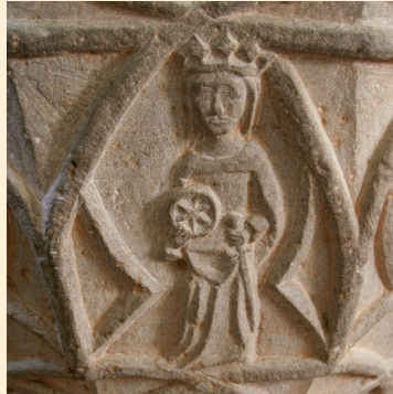
Die Heilige Katharina war eine Märtyrerin aus Alexandria im 4. Jahrhundert. Das Rad war ihr Marterinstrument.