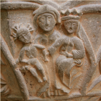
Die Heilige Anna Selbdritt: Die Heilige Anna hält ihre Tochter Maria und deren Sohn Jesus auf dem Schoß.

Auf jeder der acht Seiten ist zwischen den Ranken ein Relief heraus gemeißelt. Sie alle erzählen uns von der damaligen Glaubenswelt, dem Heiligenkult und den weltlichen Machtverhältnissen. Der Eselskopf in einem Zwickel am oberen Rand weist auf die Herren von Eisenbach hin, die Riedesel. Für zwei Reliefs, den Lilienstab und die sogenannte Rosette, habe ich noch nicht den Sinn herausgefunden. Sie werden deshalb hier noch nicht abgebildet.