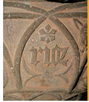
Die gotische Jahreszahl 1502.

„Die Taufe ist nicht allein schlicht Wasser, sondern ist das Wasser in Gottes Gebot gefasst und mit Gottes Wort verbunden.“