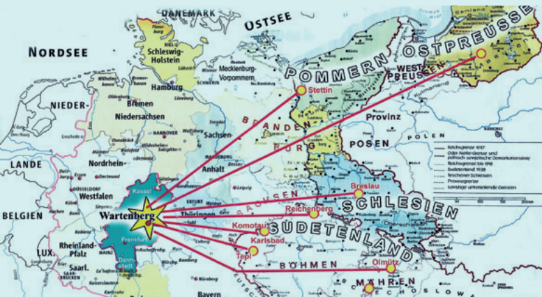
Gebiete der Heimatvertriebenen und Flüchtlinge 1945.