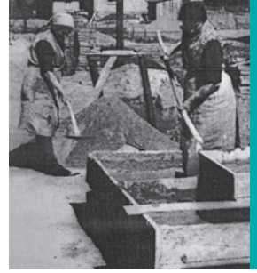
Frauen und Männer beim Bauen.

Zur gesellschaftlichen Anpassung kam vielfach die berufliche Anpassung hinzu, die teilweise ein sozialer Abstieg war. So wurde zum Beispiel der selbständige Kaufmann im Einzelhandel zum Buchdrucker in Fulda. Die Menschen nahmen jede erdenkliche Arbeit an. Wobei den Leuten und der Gegend zugutekam, dass Menschen mit landwirtschaftlichem Wissen dabei waren, die als Arbeitskräfte dort einspringen konnten, wo Bauern und deren Söhne gefallen oder in Gefangenschaft waren.